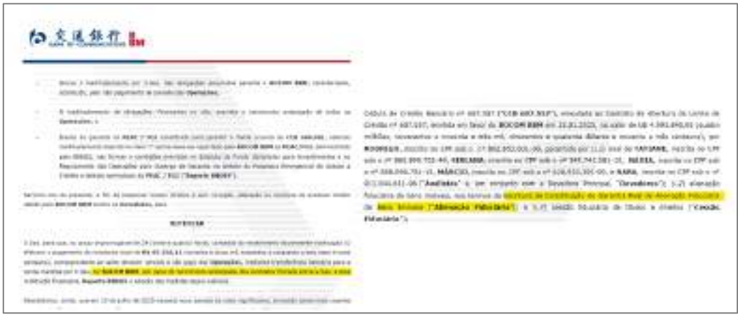
Figure 3: Notificação - Banco BOCOM - pagamento sob pena de consolidação de propriedade. (DOC. 17)

Para além dos riscos já apontados, há também a iminente consolidação da propriedade da Fazenda Alvorada , uma das primeiras e principais fazendas do grupo, pelo credor fiduciário Banco BOCOM . Trata-se de imóvel indispensável à continuidade das atividades agropecuárias, pois nele se concentram grande parte das áreas produtivas.