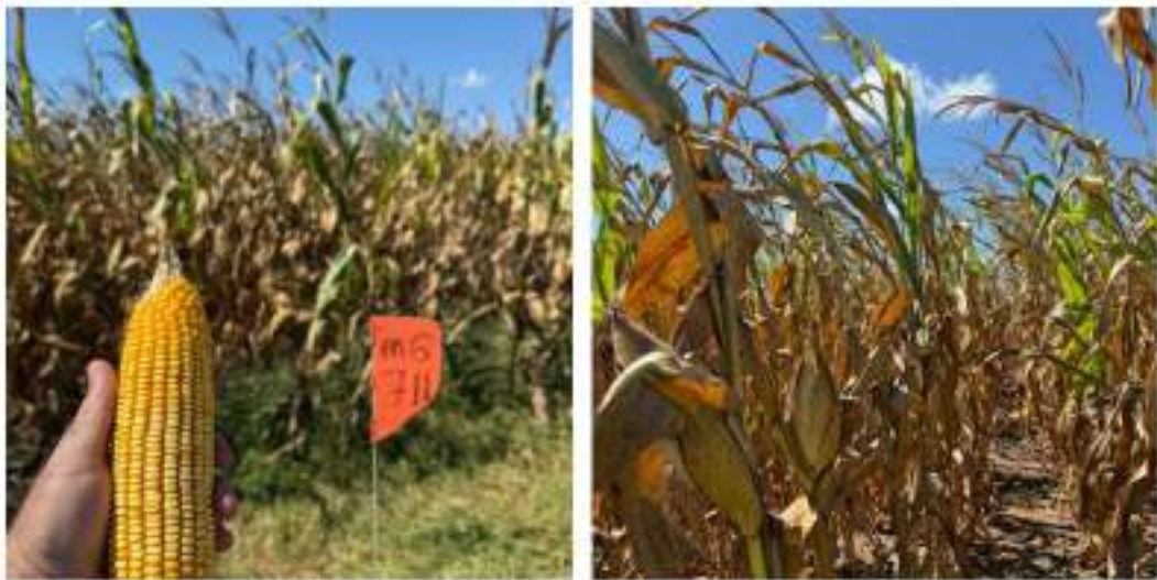
Figura 9: Lavoura de Milho.