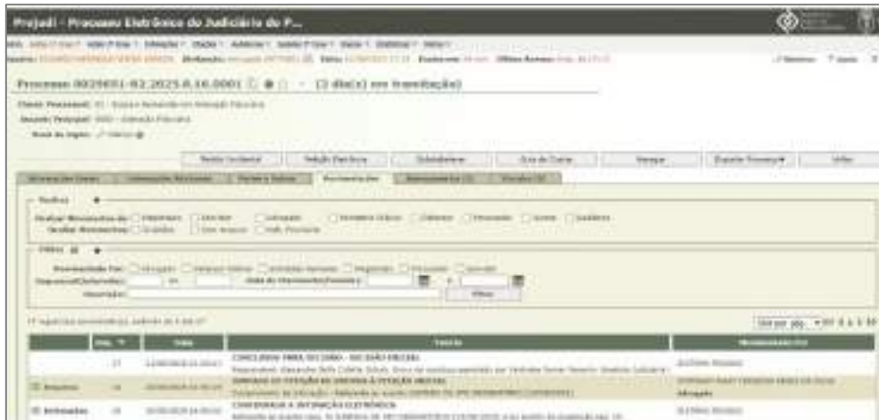
Figure 1: Ação de busca e apreensão - Banco CNH - Para apreensão de 26 maquinários.

um dos requerentes, Rodrigo Doerner, visando à apreensão de mais de 26 bens maquinários utilizados diretamente na atividade rural do grupo . A retirada desses bens inviabilizaria de forma imediata o preparo do solo, o plantio e a colheita, paralisando por completo a produção agrícola e pecuária.