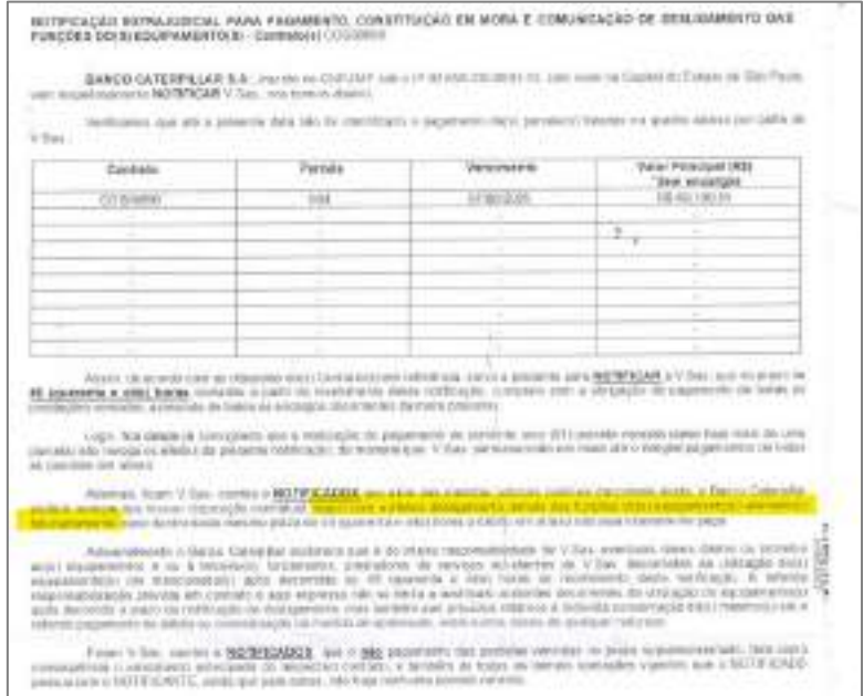
Figure 2: Banco Caterpillar - Notificação para pagamento sob pena do desligamento das maquinas. (DOC. 16)

Para além dos riscos já apontados, há também a iminente consolidação da propriedade da Fazenda Alvorada , uma das primeiras e principais fazendas do grupo, pelo credor fiduciário Banco BOCOM . Trata-se de imóvel indispensável à continuidade das atividades agropecuárias, pois nele se concentram grande parte das áreas produtivas.