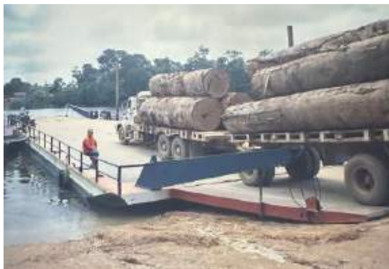
Figura 3: Operação das Balsas.