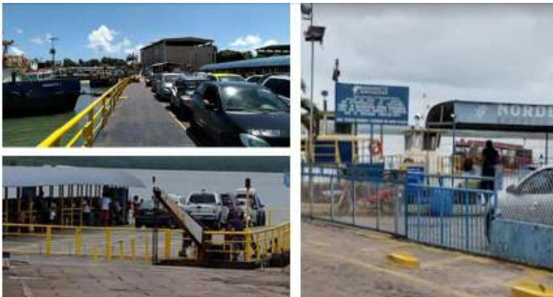
Figura 12: Balsas - Nordeste navegações.

Nordeste Navegações Ltda. – Fundada em 1986, na Paraíba, é responsável pela operação de balsas , atividade que marcou a origem do grupo e que permanece como uma das principais frentes logísticas, garantindo o transporte fluvial de pessoas, insumos e mercadorias.