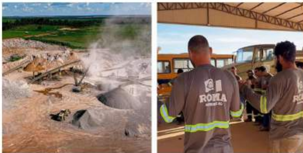
Figura 17: Roma Mineração.

O Grupo Id é formado por produtores rurais e empresas que se complementam em diferentes setores. Com décadas de atuação, o grupo foi pioneiro no desenvolvimento de Sinop e do Nordeste do Mato Grosso, desempenhando papel essencial na formação da base econômica regional. Seja no campo, na logística fluvial e rodoviária, no setor mineral ou na gestão patrimonial, a família mantém seu compromisso com o trabalho, a geração de empregos, a inovação e o desenvolvimento sustentável.