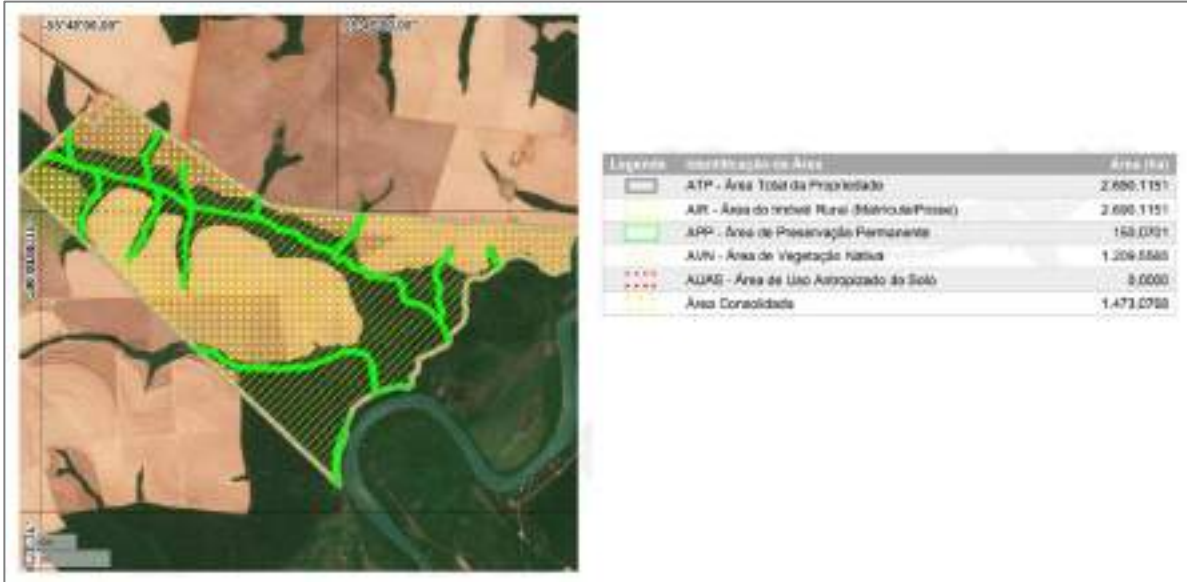
Figure 4: Demonstração da essencialidade de parte da Fazenda Alvorada.