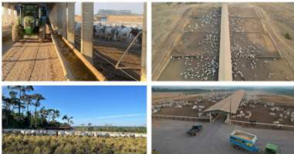
Figura 7: Atividade - Pecuária.

A atividade agropecuária conduzida pelos membros da família abrange tanto a pecuária quanto a agricultura, especialmente o cultivo de soja, milho e arroz, consolidando o grupo como importante produtor rural da região.