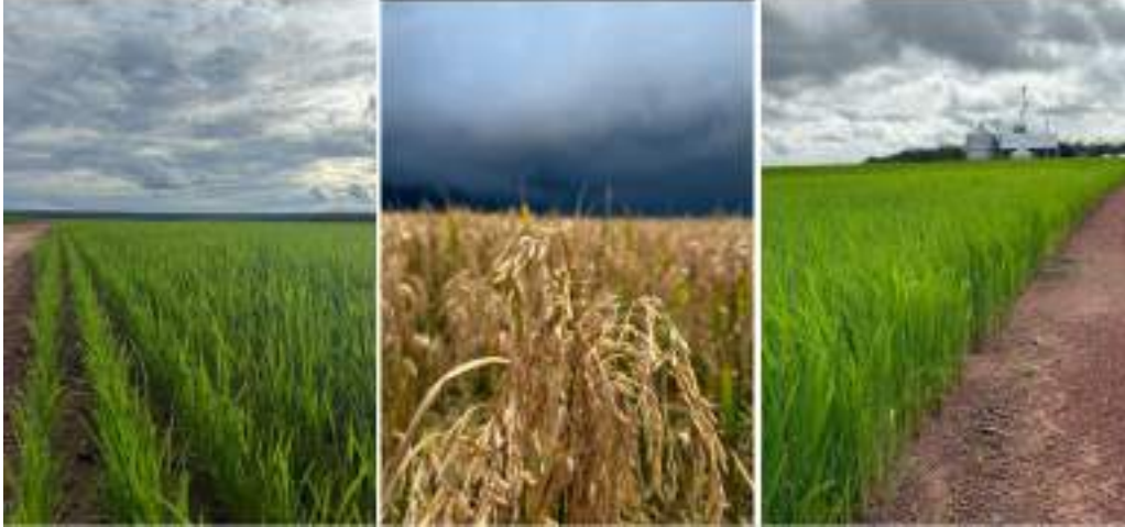
Figura 8: Lavoura de Arroz.