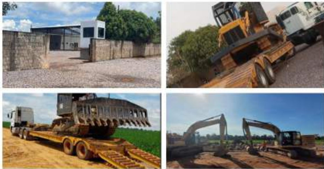
Figura 15: Transporte e locações - Gusmin.

Gusmin Transportes Ltda. – Criada em 2010, é especializada em transporte de cargas diversas e na locação de equipamentos.