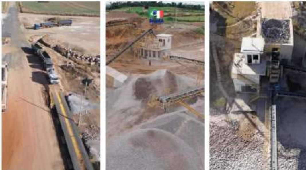
Figura 16: Roma mineração.

A operação mineral foi implantada dentro da própria Fazenda Alvorada, aproveitando de forma responsável os recursos disponíveis na área, sem comprometer a atividade agropecuária tradicional, mas sim integrando os dois modelos de forma equilibrada. Essa escolha reforça a multifuncionalidade produtiva da fazenda, hoje referência não apenas na lavoura e na pecuária, mas também na atuação mineral.