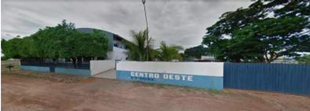
Figura 13: Balsas - Centro Oeste Navegações.

Doerner & Cia Ltda. – Criada em 2010, também no Mato Grosso, fortaleceu a capacidade de operação de balsas, complementando as frentes já existentes e ampliando a estrutura de atendimento no transporte hidroviário.