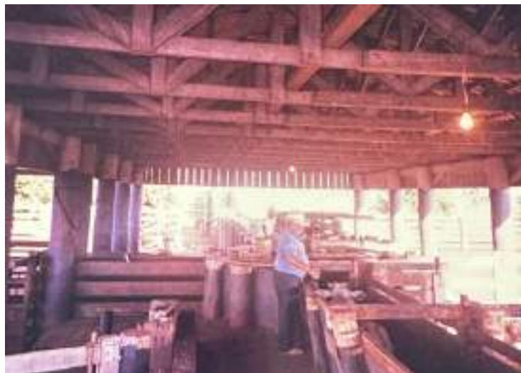
Figura 4: Waldir Doerner na Fazenda Alvorada.

Paralelamente, a família iniciou e consolidou suas atividades como produtores rurais. Ao longo da década de 1980, adquiriu pequenas propriedades, que gradualmente foram abertas para produção agrícola. Na metade da década de 1990, incorporou também a pecuária, diversificando a base produtiva e fortalecendo sua presença no setor agropecuário.