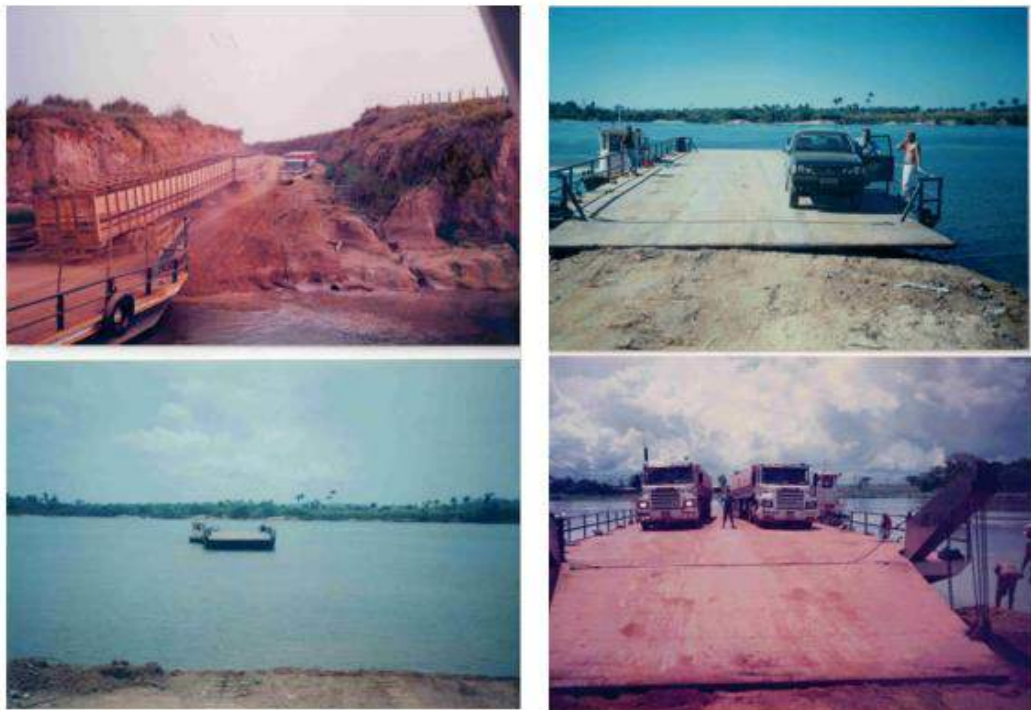
Figura 2: Balsas.

Foi por meio dessas balsas que boa parte da base logística e econômica da região se desenvolveu, e a história empresarial do grupo familiar começou a ser escrita. Com a consolidação da empresa de transporte, Waldir decidiu investir em terras, ampliando os horizontes do grupo.