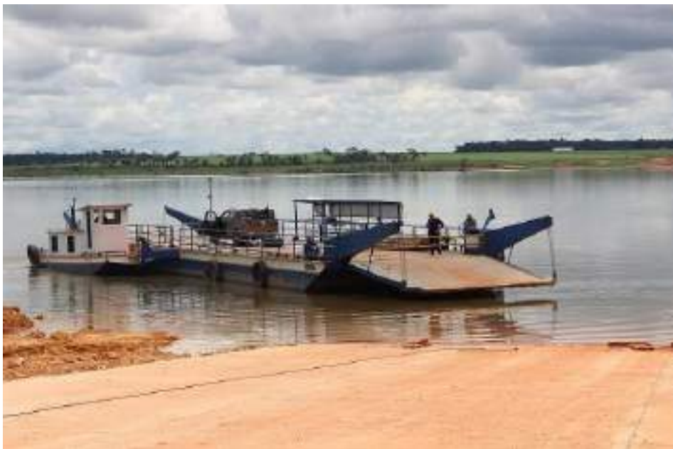
Figura 14: Balsas - Centro Oeste Navegações.

Doerner & Cia Ltda. – Criada em 2010, também no Mato Grosso, fortaleceu a capacidade de operação de balsas, complementando as frentes já existentes e ampliando a estrutura de atendimento no transporte hidroviário.