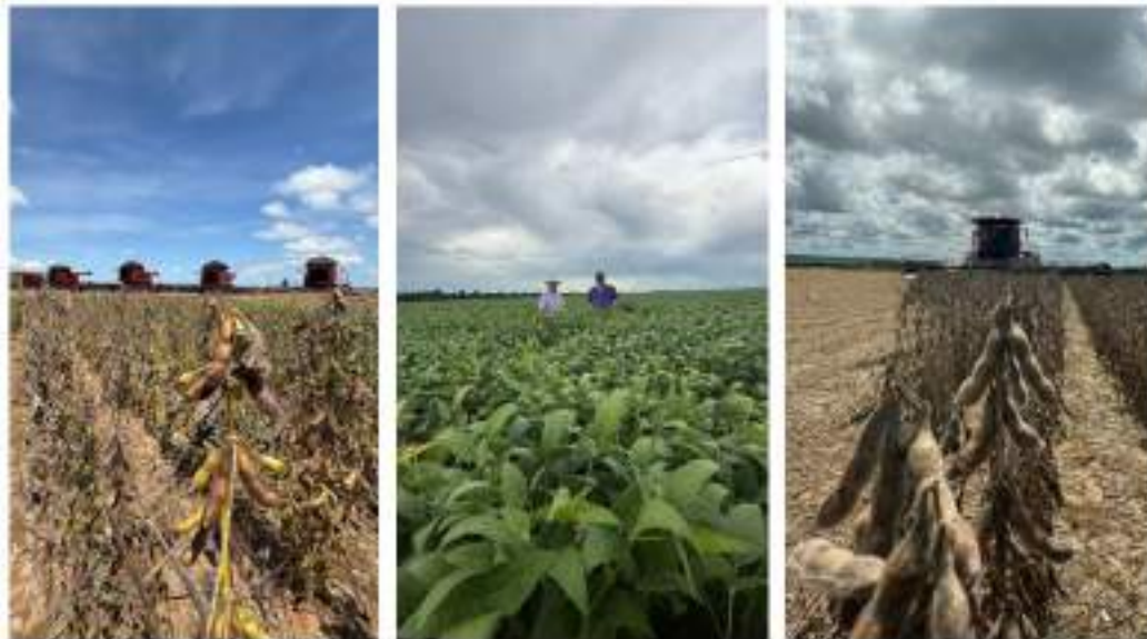
Figura 10: Lavoura de soja