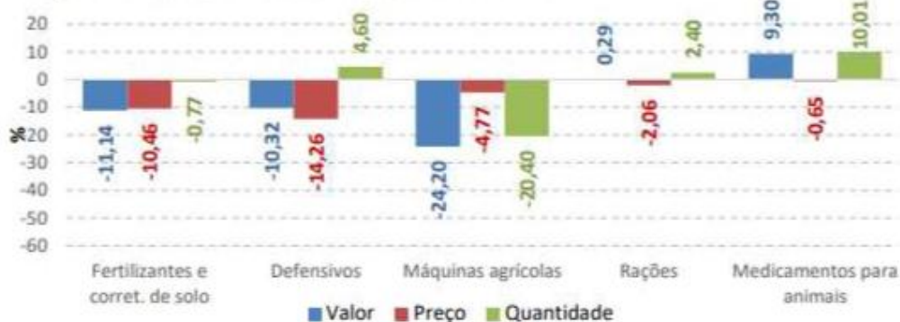
Figura 1. Insumos: variação (%) anual do volume, dos preços reais e do valor bruto da produção – 2024/2023 com informações até setembro