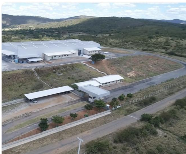
planta de Anagé/BA

Atualmente, o Grupo Requerente se encontra instalado numa moderna planta fabril localizada no Município de Santo André/SP, além de possuir uma unidade industrial localizada em Anagé/BA, com cerca de 4.000 m 2 de área fabril, além de um centro de distribuição estratégico em Curitiba (PR) para eficiência logística.