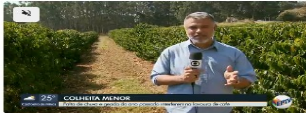
Falta de chuva e geada do ano passado interferem na safra de café

A colheita de café deste ano tem sofrido impactos devido à falta de chuva e também à forte geada registrada no Sul de Minas em 2021. A Companhia Nacional de Abastecimento (Conab) já havia alertado para a quebra de safra em cerca de 15%, mas há a possibilidade de a quantidade ser ainda menor.