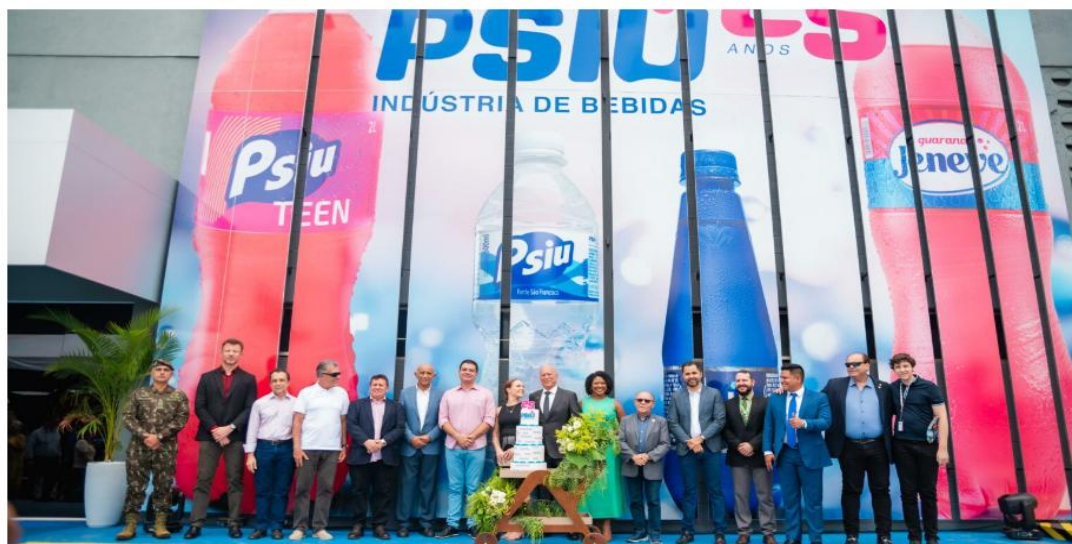
A celebração que foi realizada ao lado de autoridades políticas, empresários e colaboradores.

Psiu celebra 25 anos da 1ª fábrica mirando liderança do mercado no mercado.