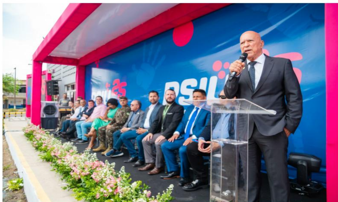
A celebração que foi realizada ao lado de autoridades políticas, empresários e colaboradores.