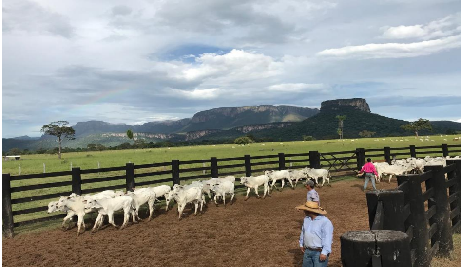
Propriedade do Grupo Nery atualmente. Na imagem, parte do rebanho.

43. A decisão de iniciar na agricultura não foi uma aventura, mas sim uma estratégia de valorização da área, para agregar mais recursos e unir pecuária e agricultura em um projeto de crescimento. Por isso, em 2019, após anos de atuação exclusiva na pecuária com criação de gados e bezerros, inseminação, a família resolveu usar uma área da propriedade para o plantio de milho, mas não foi tão produtivo e interessante aos produtores.