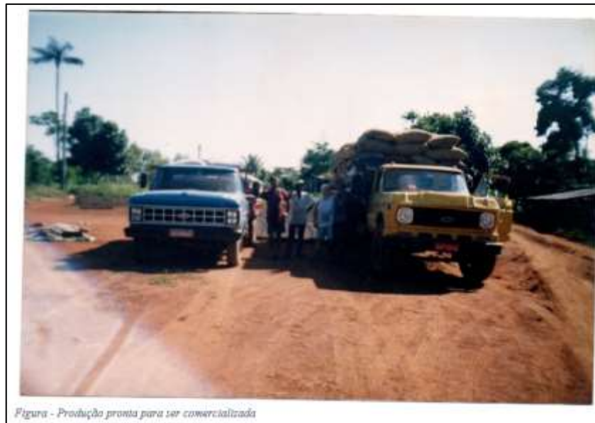
Figura - Produção pronta para ser comercializada

Na década de 90, alguns fatores como a queda dos preços do café, a concorrência de outras regiões produtoras levou os produtores a buscar atividades que ofereciam maior potencial de lucro, culminando em uma redução na área plantada e na produção cafeeira.