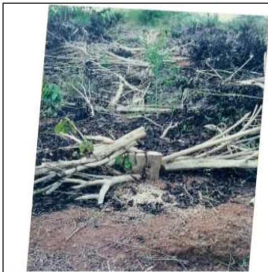
Figura - Corte da lavoura de café para a implantação de pastagem