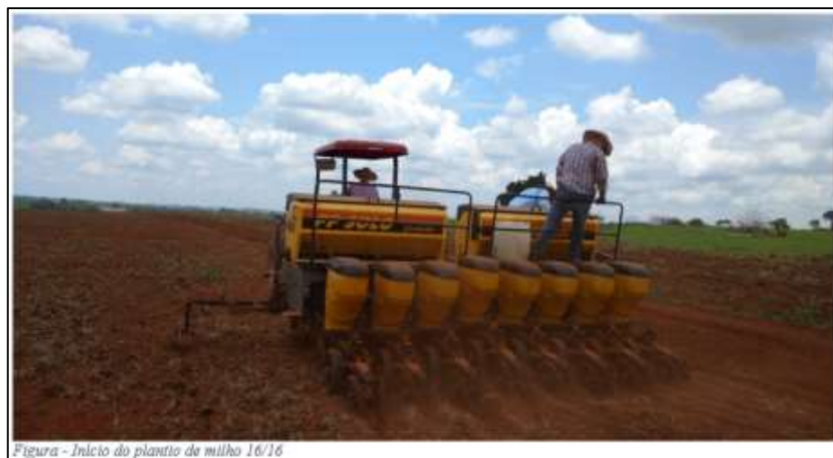
Figura - Início do plantio de milho 16/16

A atividade teve início com as áreas próprias, e conseqüentemente foram-se buscando áreas próximas para arrendamento.