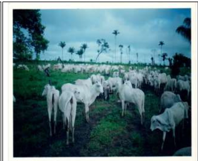
Figura - Criação de gado leiteiro da Família Zorzo