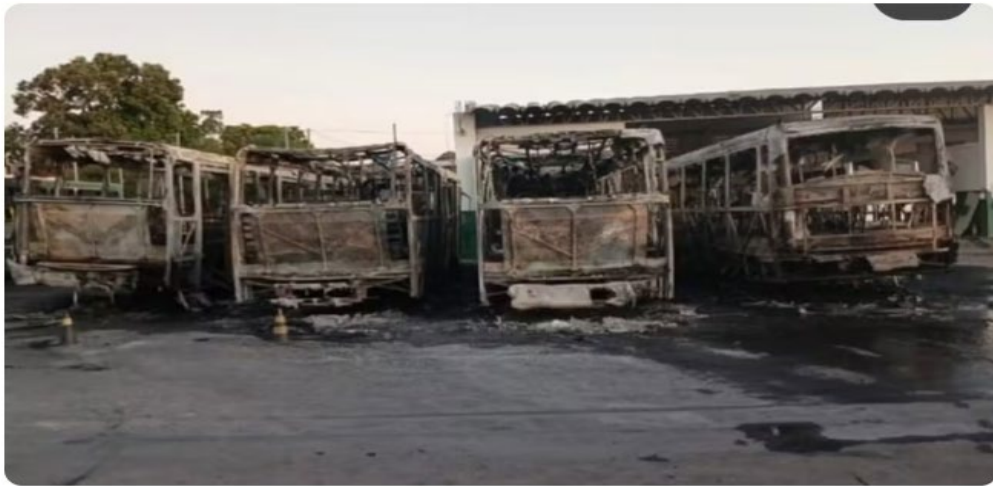
Ônibus são atingidos por incêndio na garagem da Caribus Transportes, no Bairro São João Del Rei, em Cuiabá.

https://g1.globo.com/mt/mato-grosso/noticia/2025/08/11/seis-onibus-sao-atingidos-por-incendio-em-patio-de-empresa-de-transporte-em-cuiaba.ghtml