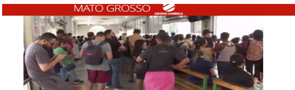
Ônibus da região do Centro Político Administrativo (CPA) estão em greve por falta de pagamento

Nesse período, foram realizadas diversas notificações formais ao Poder Concedente, alertando acerca do risco de paralisação das atividades, da dificuldade no cumprimento de obrigações trabalhistas, da aquisição de insumos essenciais e da iminência de busca e apreensão da frota por instituições financeiras — tema que chegou, inclusive, a ser noticiado: