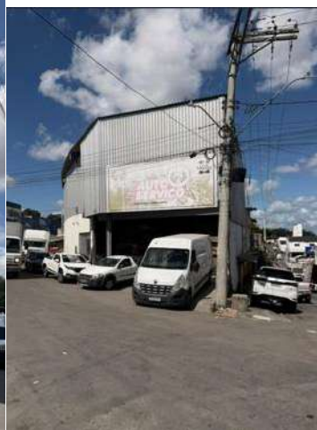
Foto da filial