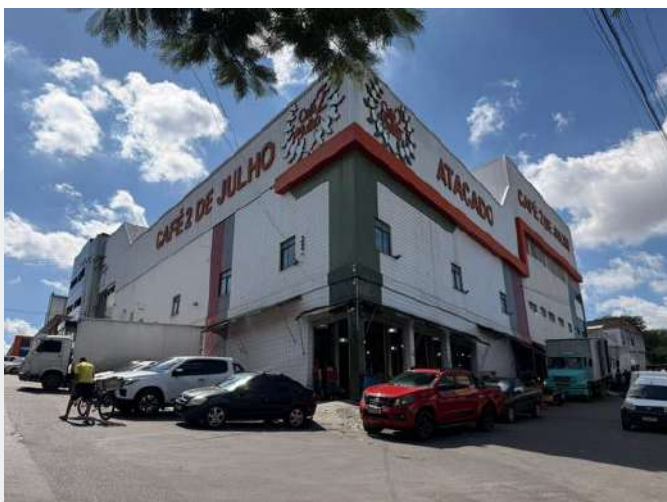
Foto da Matriz do Atacado 2 de Julho

15. Vieram então os anos de expansão. Reformas, ampliação de depósito, aumento do volume de vendas, crescimento da carteira de clientes e geração de empregos.